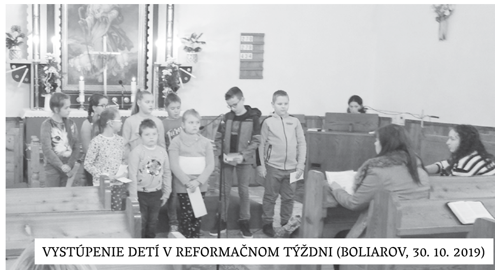
VYSTÚPENIE DETÍ V REFORMAČNOM TÝŽDNI (BOLIAROV, 30. 10. 2019)

mácia pre tých, ktorí pred 50 rokmi (teda v rokoch 1968 a 1969) skladali svoj konfirmačný sľub v našom cirkevnom zbere. Na stretnutie prišlo celkom 19 bývalých konfirmandov. Po centrálnych bohoslužbách v Rankovciach sa potom spoločne zdieľali o prežitých rokoch pri obede v Herľanoch.