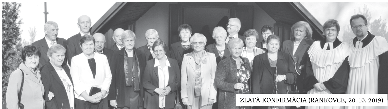
ZLATÁ KONFIRMÁCIA (RANKOVCE, 20. 10. 2019)

o počiatkovej eufórii a neskoršom sklamaní z príliš dlhej a ťažkej cesty k slobode. Tu sa môžeme pýtať – prečo bola taká dlhá a ťažká? Moja odpoveď je, že otroctvo si niesli Izraeliti