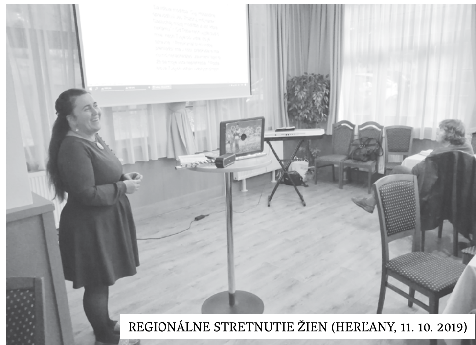
REGIONÁLNE STRETNUTIE ŽIEN (HERLANY, 11. 10. 2019)

Zdroj: www.nezabudnitecitat.sk (krátené)