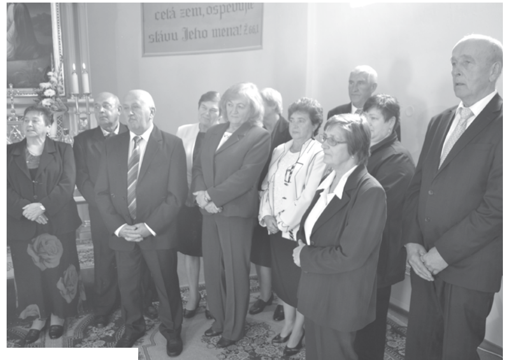
ZLATÁ KONFIRMÁCIA (RANKOVCE, 20. 10. 2019)