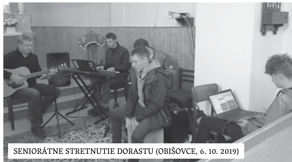
SENIORÁTNE STRETNUTIE DORASTU (OBIŠOVCE, 6. 10. 2019)

Potom je tu La Castanyada, originálne katalánsky festival. (Barcelona je katalánske mesto a aj keď teraz Katalánsko patrí k Španielsku, oni sa k svojej osobitosti a k svojim tradíciám hlásia.) Niekedy sa La Castanyada začínala 1. novembra, no v posledných rokoch, práve kvôli príchodu Halloweenu a tradícií, ktoré nie sú ich domáce, začína už 31. ok-