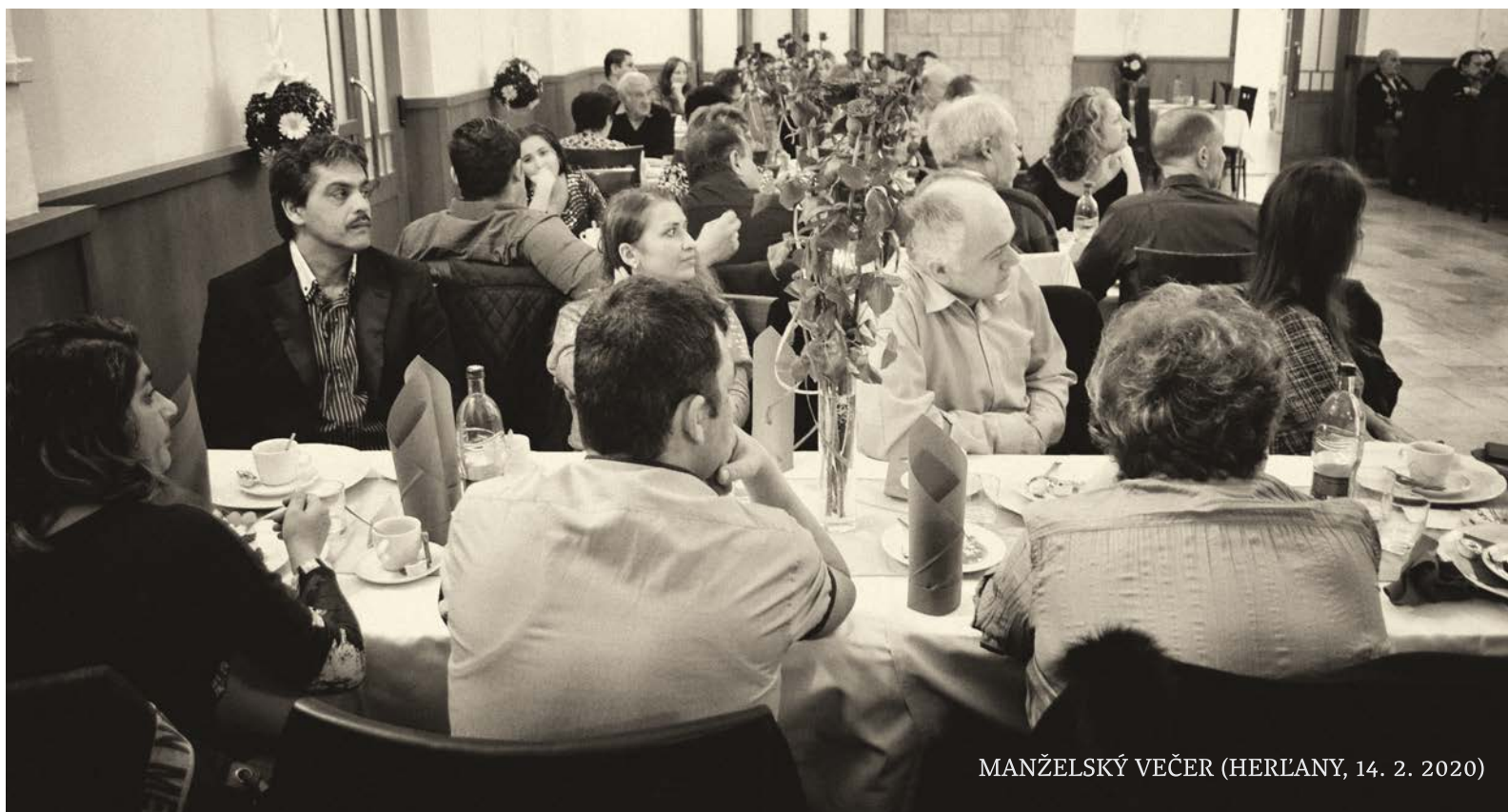
MANŽELSKÝ VEČER (HERĽANY, 14. 2. 2020)