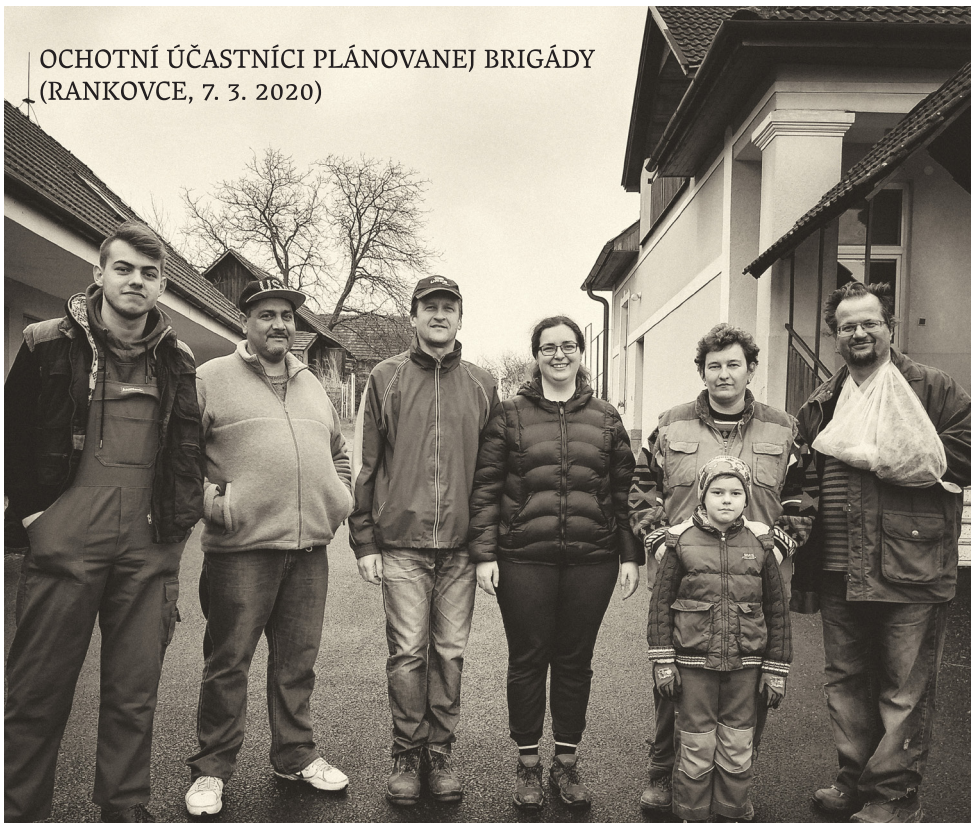
OCHOTNÍ ÚČASTNÍCI PLÁNOVANEJ BRIGÁDY (RANKOVCE, 7. 3. 2020)