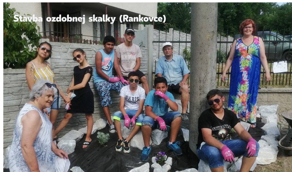
Stavba ozdobnej skalky (Rankovce)

Od svojho počiatku sa na populárno-vedeckej úrovni venuje problematike siekt, kultov a náboženských hnutí či hnutí, ktoré súvisia s novou religiozitou spoločnosti. Jeho poslaním je na základe odborného monitoringu a analýzy súčasnej náboženskej domácej a zahraničnej scény verejnosti sprístupňovať objektívne a kvalifikované informácie a poradenstvo. Úzko spolupracuje s českým časopisom Dingir rovnakého zamerania, napokon náboženská scéna u nás a u našich susedov je veľmi podobná.