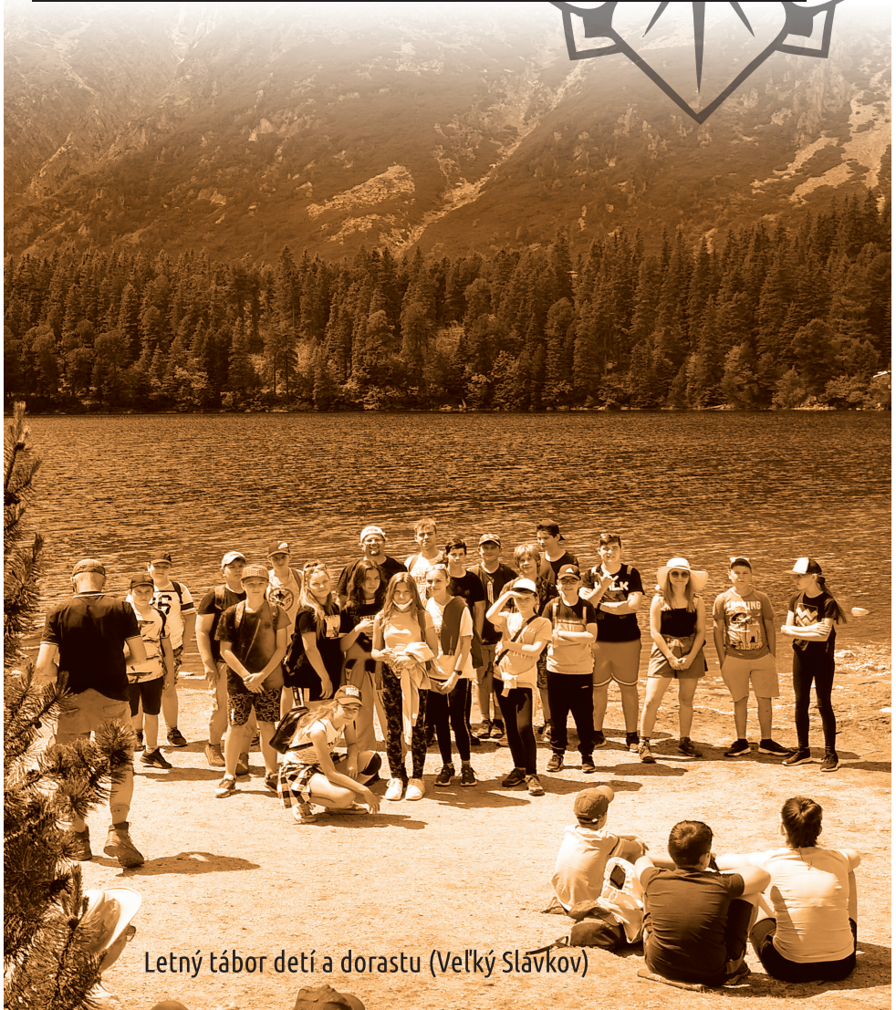
Letný tábor detí a dorastu (Veľký Slávkov)