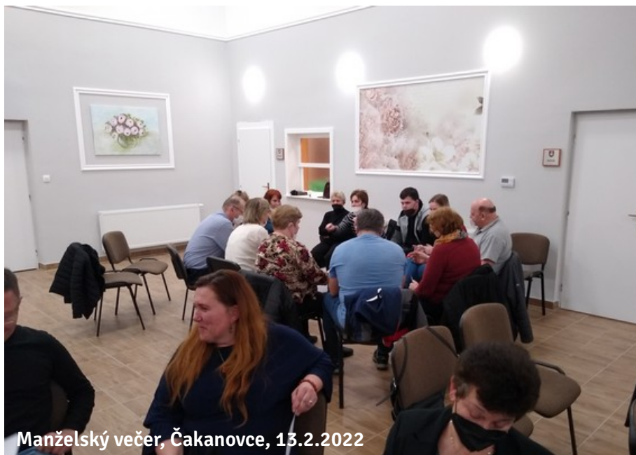
Manželský večer, Čakanovce, 13.2.2022